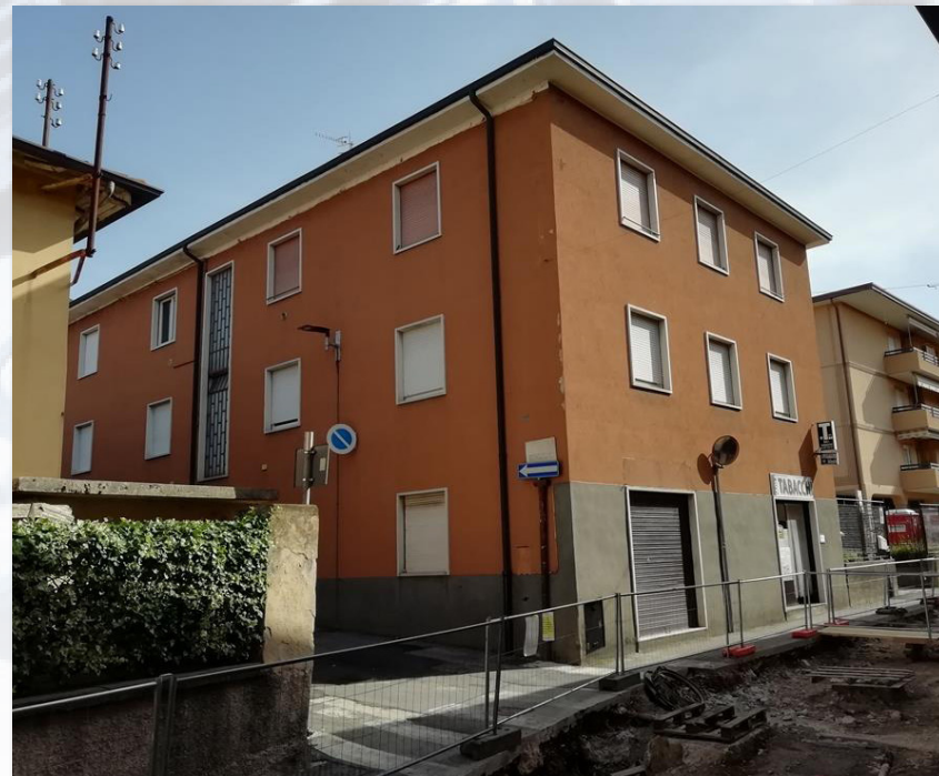
NEMBRO (BG) Via Borgogno 2