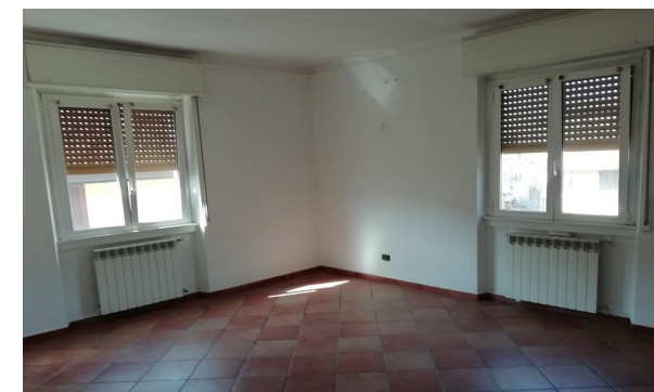
Vista interna unità residenziale

Lo stato di manutenzione e conservazione si può ritenere buono.