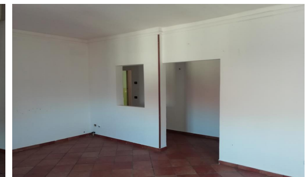
Vista interna unità residenziale