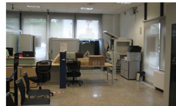
Vista interna unità commerciale

Lo stato di manutenzione e conservazione si può ritenere buono.