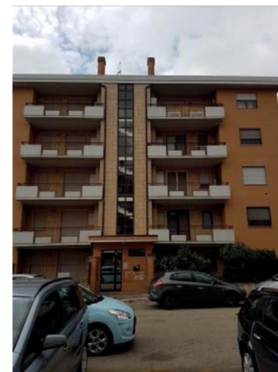
Vista esterna fabbricato