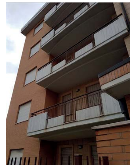
Vista esterna fabbricato