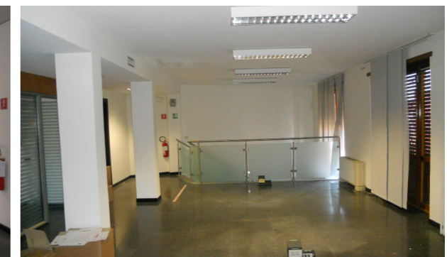
Vista interna unità direzionale