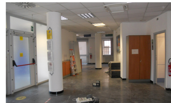
Vista interna unità direzionale

Lo stato di manutenzione e conservazione è buono.