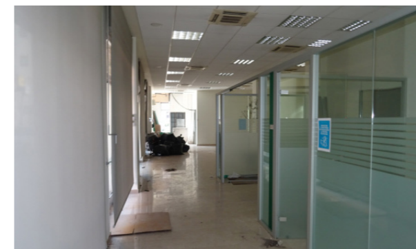
Vista interna unità direzionale

Lo stato di manutenzione e conservazione è discreto.