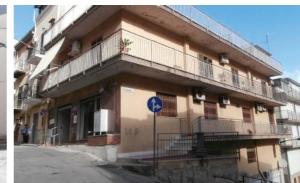
Vista esterna della proprietà