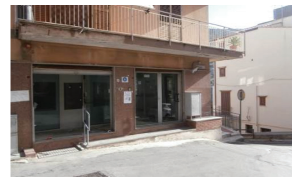
Vista esterna della proprietà