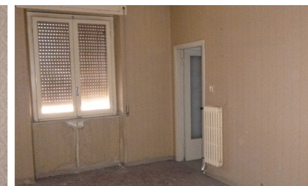
Vista interna unità residenziale