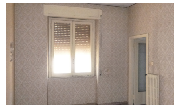
Vista interna unità residenziale

Le unità necessitano di ristrutturazione.