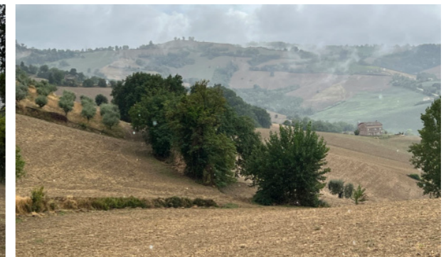
Vista generale dei terreni