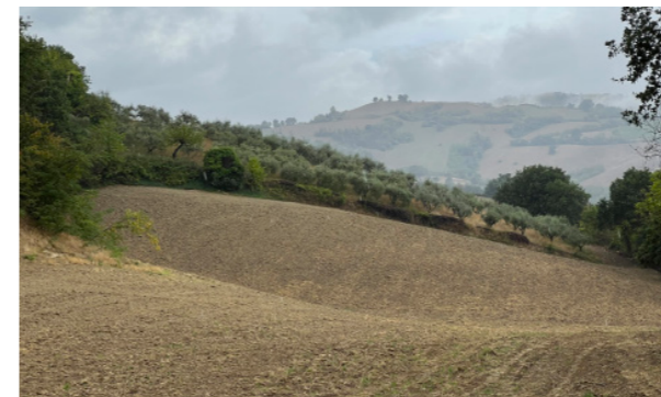
Vista generale dei terreni

I terreni allo stato attuale appaiono curati ma non coltivati; sono caratterizzati da una buona accessibilità e da una buona posizione, soprattutto per quanto riguarda la caratteristica della panoramicità del luogo.