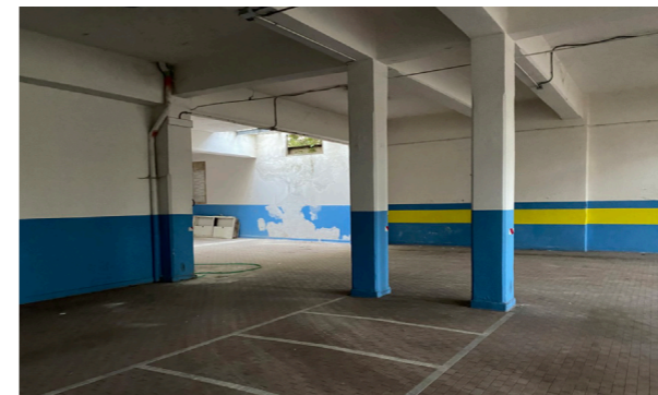
Vista interna dell'autorimessa