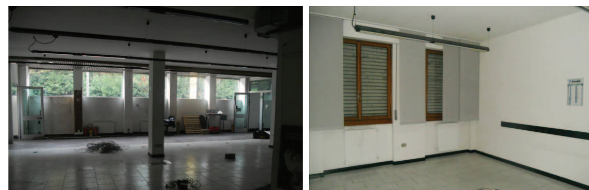
Vista interna della proprietà

Lo stato di manutenzione della porzione immobiliare si può complessivamente ritenere discreto.