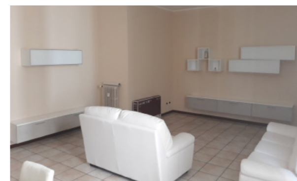
Vista interna unità residenziale

Lo stato di manutenzione e conservazione si può ritenere buono.