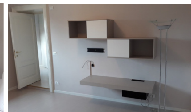
Vista interna unità residenziale