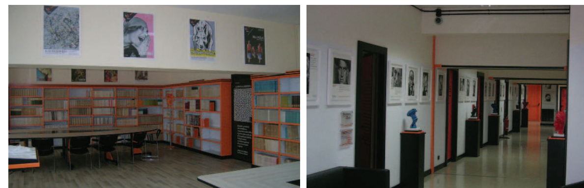
Vista interna della proprietà

Lo stato manutentivo può considerarsi discreto.