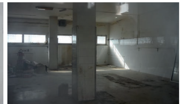
Vista interna sub 28