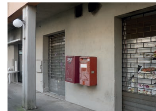
Vista esterna sub 28

L'unità risulta in stato di abbandono e mai ristrutturata dopo la cessazione dell'attività un tempo insediata (non visionabile internamente).