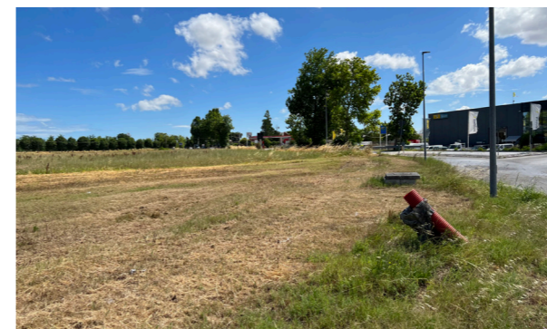
Vista generale dei terreni

Le aree edificabili, di cui fa parte anche l'area urbana, hanno una superficie totale di circa 53.460 mq, mentre i terreni agricoli una superficie totale di 11.230 mq.