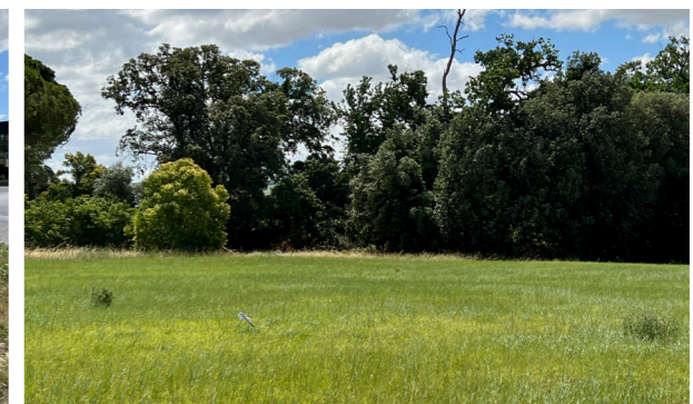
Vista generale dei terreni