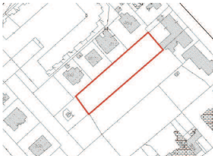
Estratto di mappa