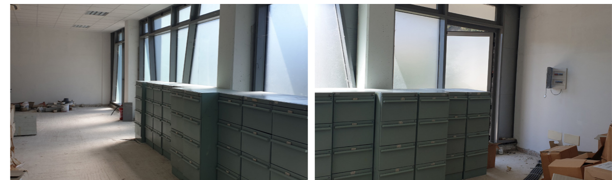
Vista interna unità commerciale/direzionale

Per quanto riguarda la parte già realizzata lo stato di manutenzione e conservazione è buono.