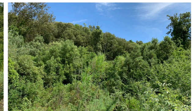
Vista generale dei terreni