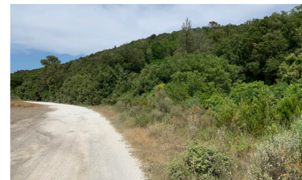
Vista generale dei terreni