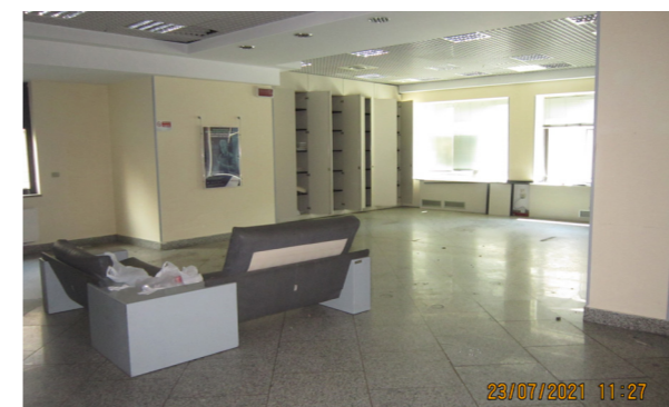
Vista interna unità commerciale/direzionale

Lo stato di manutenzione e conservazione generale di entrambe le unità è discreto.