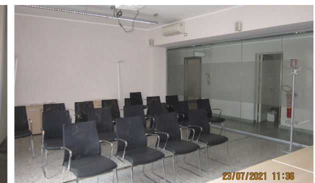
Vista interna unità direzionale