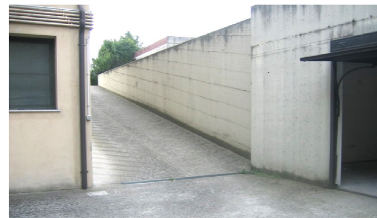
Vista della proprietà