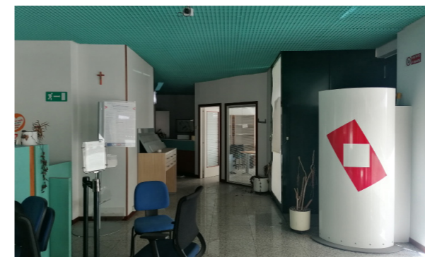
Vista interna unità commerciale/direzionale

Lo stato di manutenzione e conservazione generale è discreto.