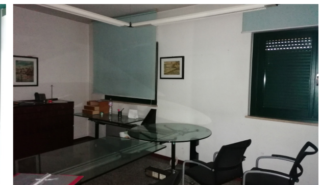
Vista interna unità commerciale/direzionale