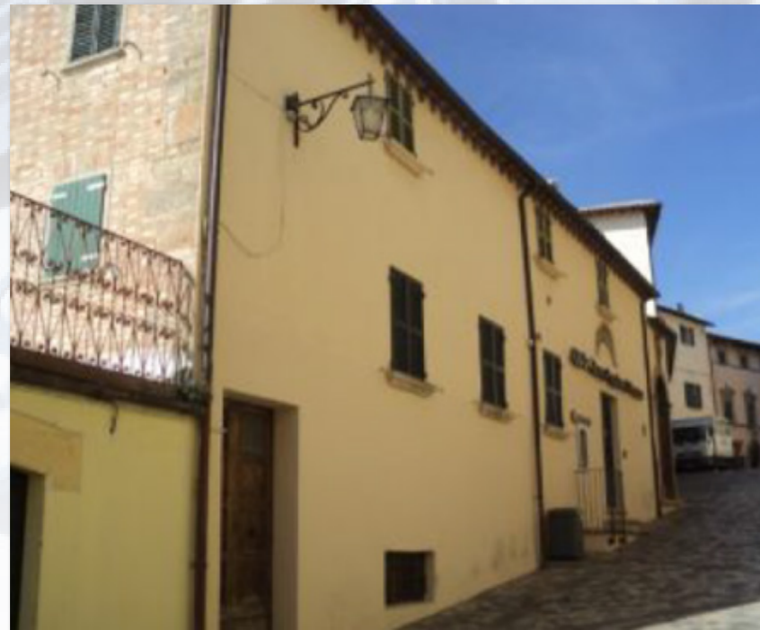
SAN LEO (RN) Via Montefeltro, 24