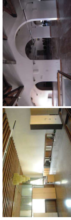
Visita interna della proprietà

Gli impianti sono indipendenti da quelli della filiale e i vani tecnici si trovano al piano primo interrato, a cui si accede dal cortile interno. Buono lo stato di manutenzione per tutte le parti costituenti la proprietà.