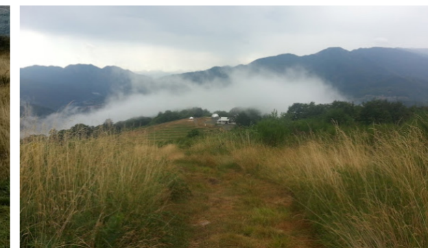
Vista generale del terreno