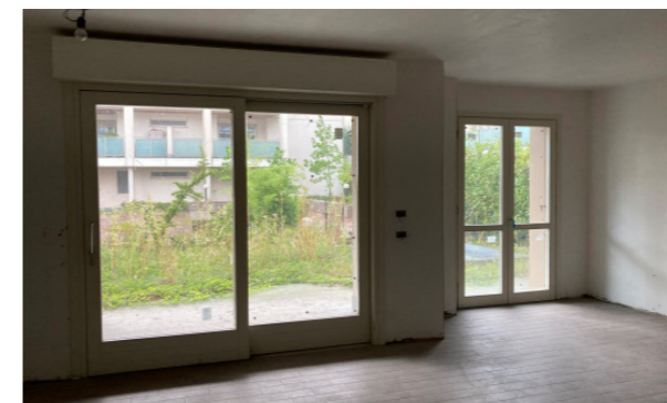
Vista interna unità residenziale

Lo stato di manutenzione e conservazione si può ritenere buono.