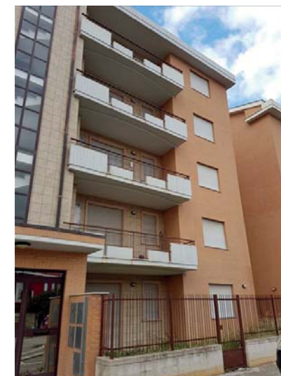
Vista esterna fabbricato