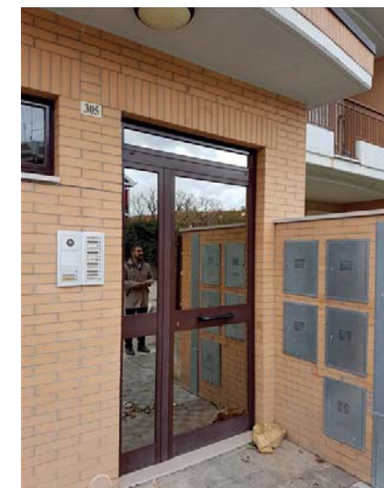
Vista esterna fabbricato