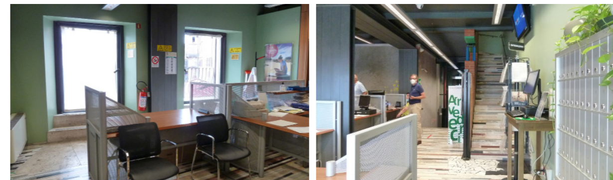
Vista interna unità direzionale

Lo stato di manutenzione e conservazione è buono.