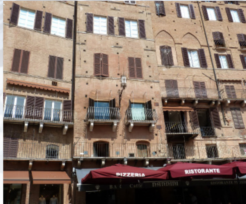
SIENA (SI) via di Città, 23