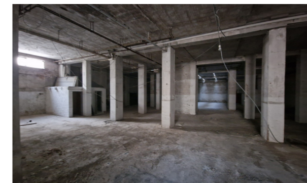
Vista interna unità ad uso magazzino/deposito

Lo stato di manutenzione e conservazione è discreto, però l'unità non risulta finita: la pavimentazione è in calcestruzzo grezzo e i muri non risultano tinteggiati.