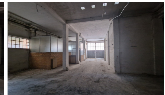
Vista interna unità ad uso magazzino/deposito