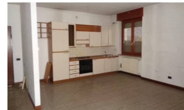
Vista interna unità residenziale

Lo stato di manutenzione e conservazione si può ritenere discreto.