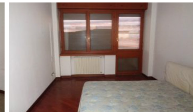
Vista interna unità residenziale