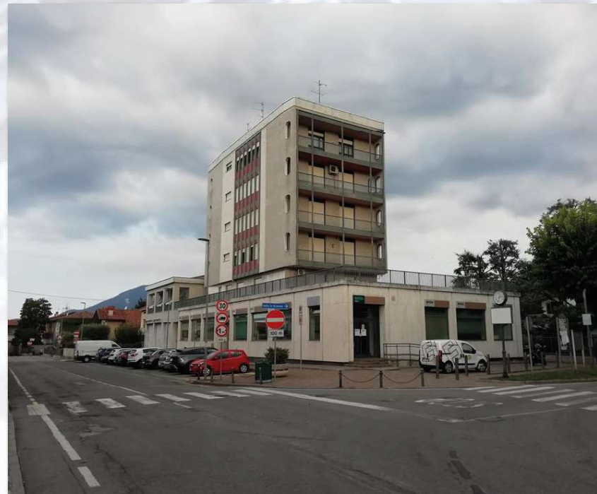
ALME' (BG) via Torre d'Oro, 2