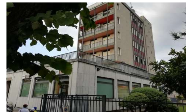
Vista generale dell'edificio

Lo stato di manutenzione e conservazione è discreto.