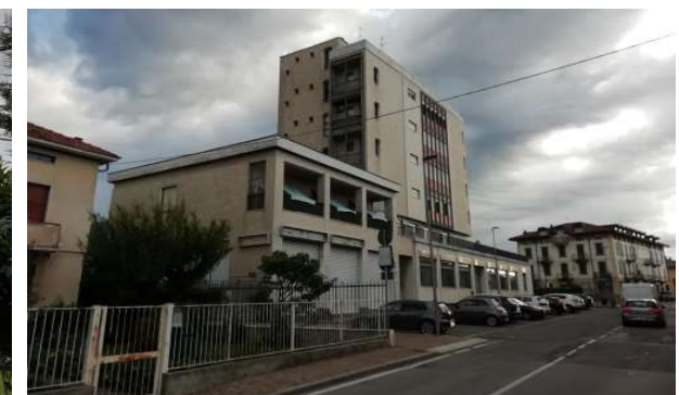
Vista generale dell'edificio