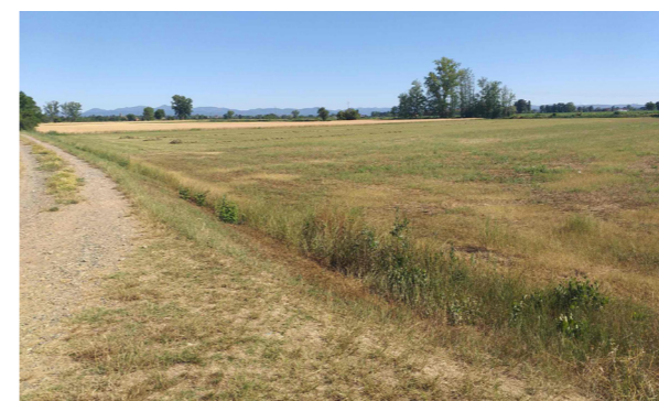
Vista generale del terreno

La Proprietà è costituita da un terreno agricolo, di superficie pari a 11.810 mq, a destinazione seminativo. Il terreno non è coltivato ed è destinato a prato.