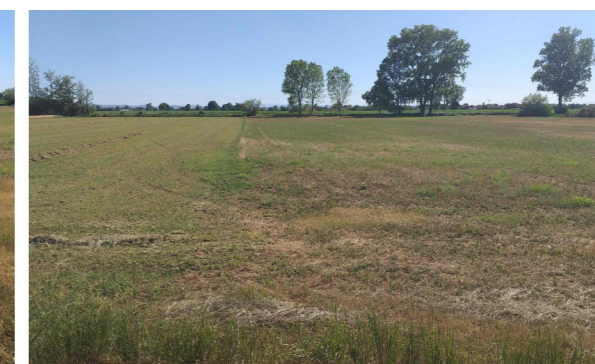
Vista generale del terreno