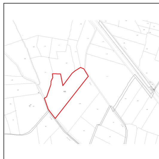
Mappa del terreno