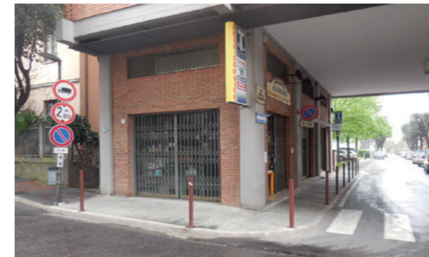
Vista esterna unità commerciale

Lo stato della proprietà risulta complessivamente buono