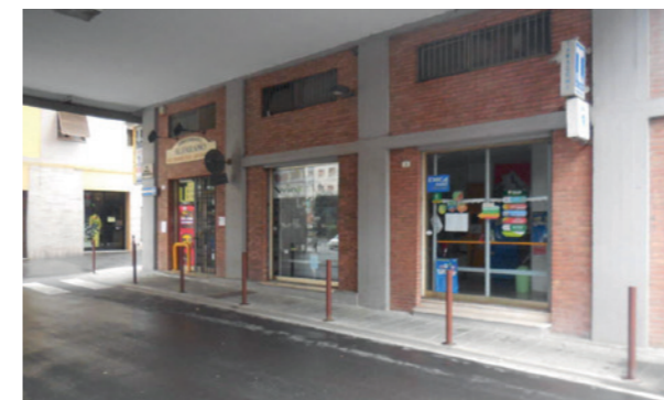
Vista esterna unità commerciale