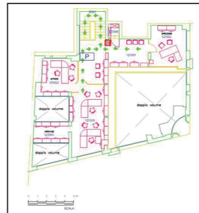
Planimetria piano ammezzato