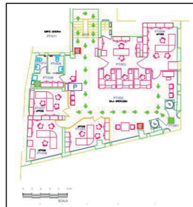
Planimetria piano terra