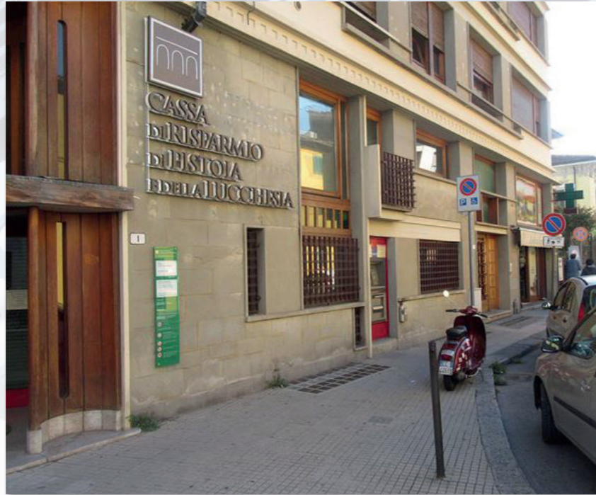
PISTOIA Via Porta Lucchese, 1