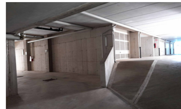
Vista interna unità