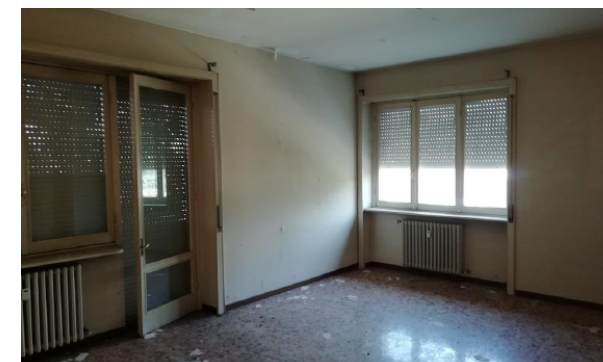
Vista interna unità residenziale

Lo stato di manutenzione e conservazione è discreto.