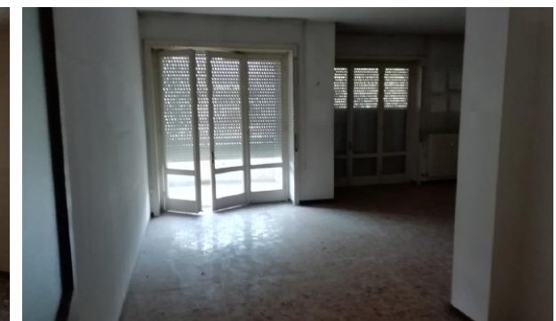
Vista interna unità residenziale