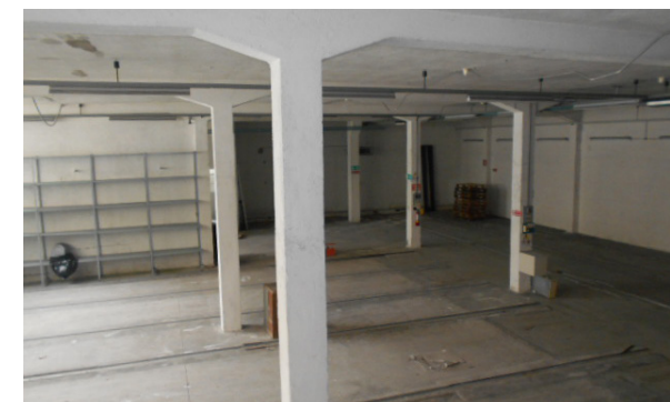
Vista interna unità ad uso deposito

L'unità immobiliare necessita di ristrutturazione.