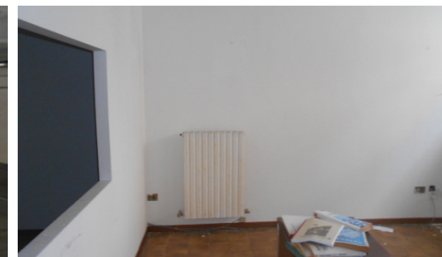
Vista interna unità ad uso deposito, porzione dedicata ad ufficio