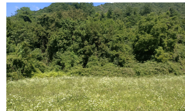
Vista generale dei terreni

Attualmente la vegetazione è cresciuta liberamente nei terreni.