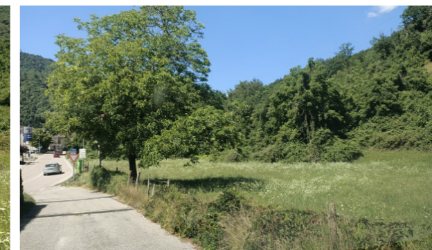
Vista generale dei terreni