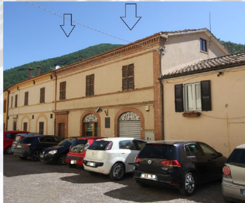
FIUMINATA (MC) piazza Giacomo Leopardi, 6A