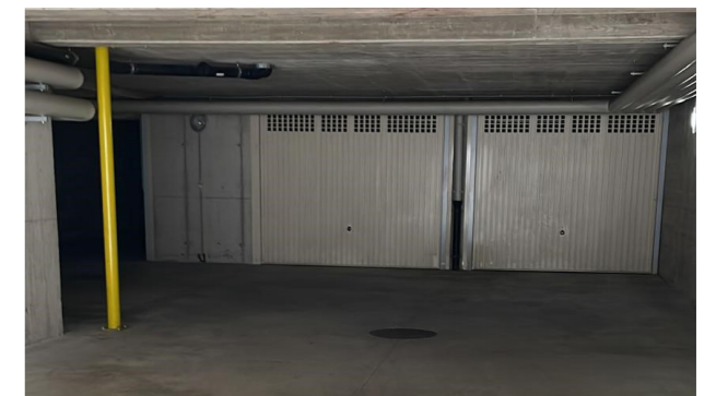
Vista interna unità