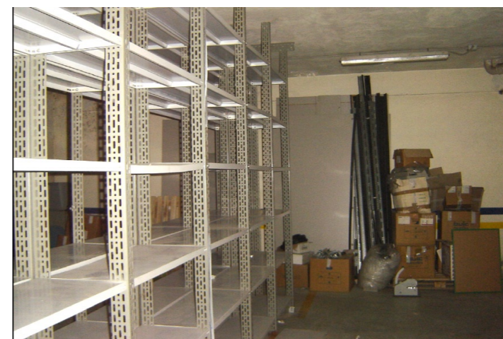
Vista interna della proprietà