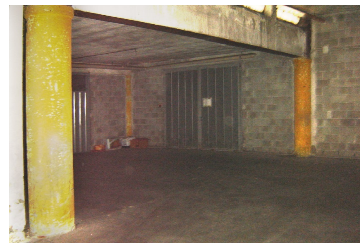
Vista interna della proprietà

La proprietà è costituita da un'unità immobiliare ad utilizzo autorimessa/magazzino, ubicata al piano interrato di un complesso edilizio a destinazione residenziale edificato nella prima metà degli anni '70. L'accesso ad entrambe le porzioni, è possibile attraverso una rampa carrabile accessibile dal cortile condominiale. Internamente la porzione evidenzia un medio livello di finiture che comprende pavimentazione realizzata in gres porcellanato e serramenti esterni in metallo.