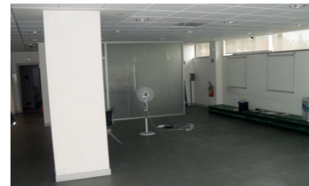
Vista interna unità commerciale

Nel complesso il locale commerciale si presenta in buono stato manutentivo sia interno che esterno.