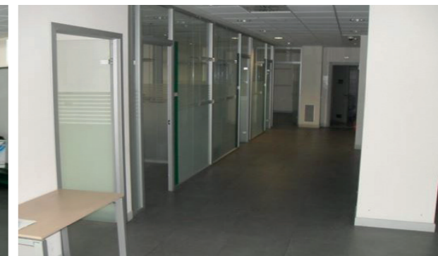
Vista interna unità commerciale