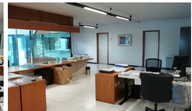
Vista interna unità direzionale