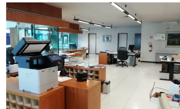
Vista interna unità direzionale

Lo stato di manutenzione e conservazione è buono.