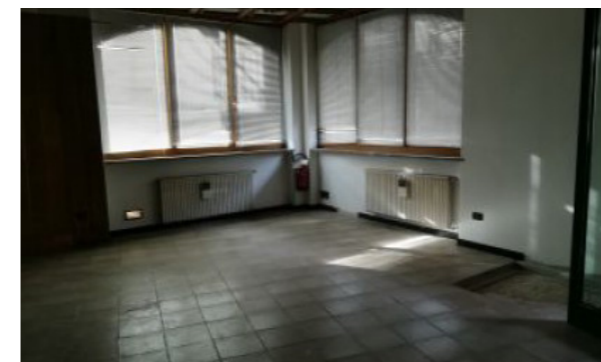
Vista interna unità commerciale/direzionale

Lo stato manutentivo e conservativo generale risulta discreto.