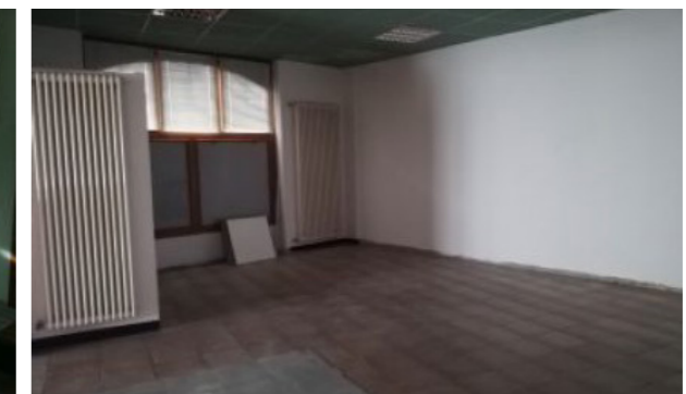
Vista interna unità commerciale/direzionale