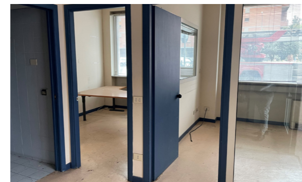
Vista interna unità direzionale/commerciale

Lo stato di manutenzione e conservazione è discreto.