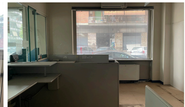
Vista interna unità direzionale/commerciale