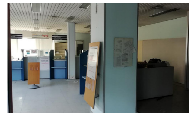
Vista interna unità commerciale/direzionale

Le finiture interne sono caratterizzate da: pavimenti in gres; rivestimenti in ceramica nei servizi; pareti perimetrali intonacate e tinteggiate; soffitto intonacato e tinteggiato al civile con impianti a vista; tramezzi realizzati con pareti mobili in legno e vetro. Lo stato di manutenzione e conservazione generale è discreto.