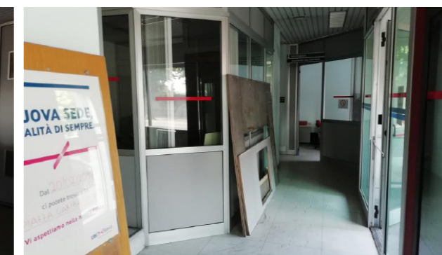
Vista interna unità commerciale/direzionale