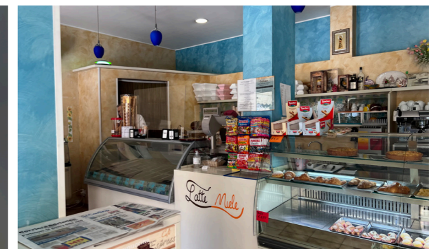
Vista interna unità commerciale