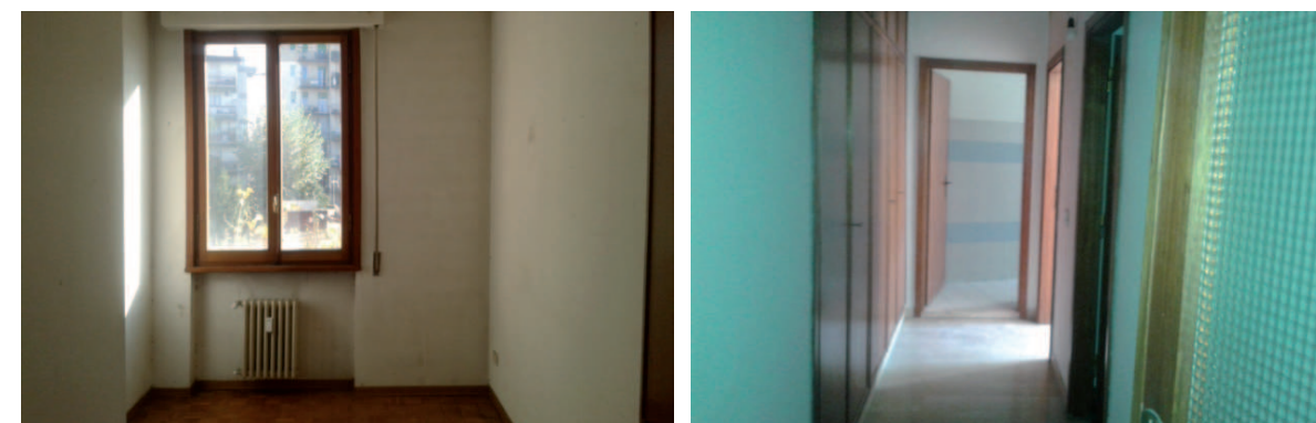
Vista interna della proprietà

La finitura interna dell'appartamento presenta pavimenti in ceramica, parquet e marmette, serramenti in legno in parte con avvolgibili ed in parte con persiane esterne, intonaci a civile e rasati a gesso e tinteggiati. L'impianto di riscaldamento è centralizzato mentre la produzione acqua calda sanitaria avviene con boiler elettrico. Lo stato manutentivo risulta complessivamente discreto.