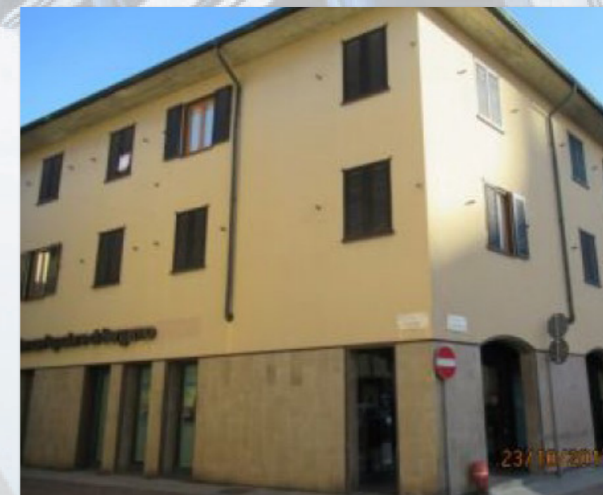
CARAVAGGIO (BG) piazza Garibaldi, 1

Intesa Sanpaolo Spa Direzione Immobili e Logistica www.proprieta.intesasanpaolo.com