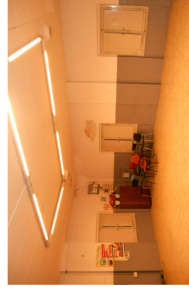
Vista interna della proprietà

Dal punto di vista impiantistico l'immobile è dotato di impianto elettrico completo quadro generale, quadri di piano, rete di distribuzione, interruttori e prese, impianto d'illuminazione completo di luci, impianto idrico con allaccio all'acquedotto comunale, impianto di riscaldamento autonomo con caldaia a gas metano e impianto di scarico con allaccio al collettore della rete fognaria comunale.