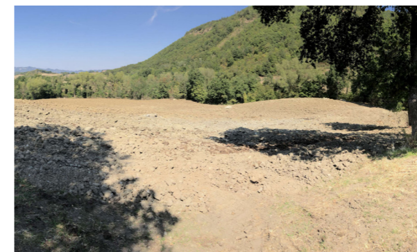
Vista generale dei terreni

I terreni hanno diverse qualità, da seminativo a pascolo e vigneto, attualmente in generale sono ricoperti da alberi e arbusti.