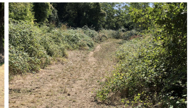
Vista generale dei terreni