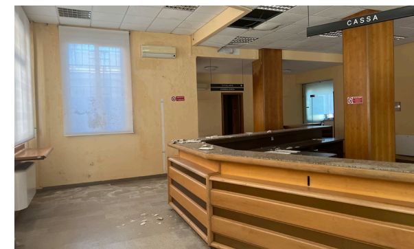
Vista interna unità commerciale/direzionale

L'unità necessita di interventi di ristrutturazione.