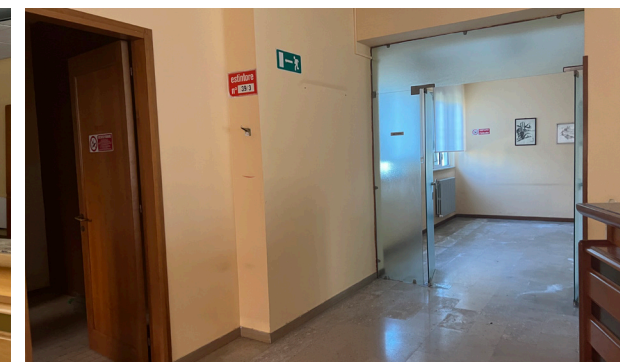
Vista interna unità commerciale/direzionale